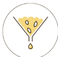
ゆずの種の アップサイクル

「ゆず油」シリーズは環境に配慮したパッケージの採用のほか、2016年からは本来捨てられるはずだった高知県北川村ゆずの種からオイルを抽出しアップサイクル原料として活用するなど、希少な素材の有効活用に努めています。またゆず農家への支援や子どもたちへの学習支援、北川村ゆずを使った化粧品の共同開発など、国内有数のゆずの産地である高知県北川村と共同で村の活性化に繋がる活動に取り組んできました。2022年には高知県北川村・ウエルシアグループ（ウエルシア薬局・よどや）と包括連携協定を締結し、活動の幅を広げています。