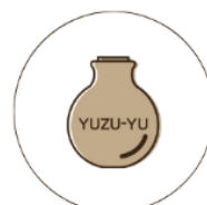
オイルミスト容器

再生ガラスを90%以上使用した エコロジーボトル 緩衝材には「再生紙成形品」を採用