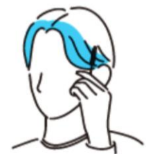
前髪・毛流れ スタイリングに