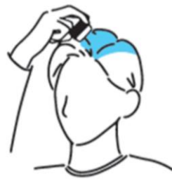
分け目の目立つ あほ毛に